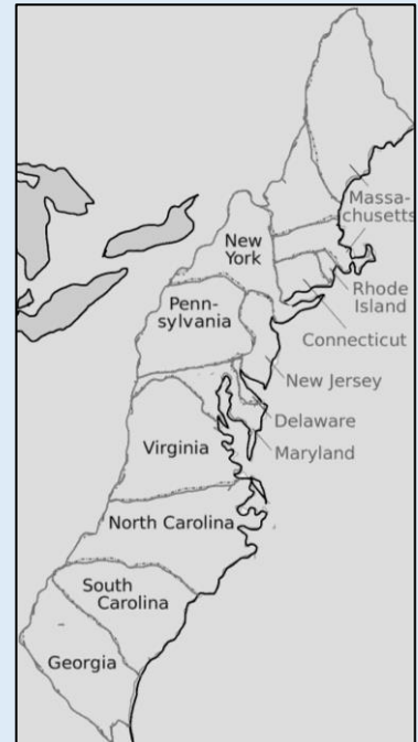
"De dertien koloniën of staten waren in oorlog geraakt met Engeland".