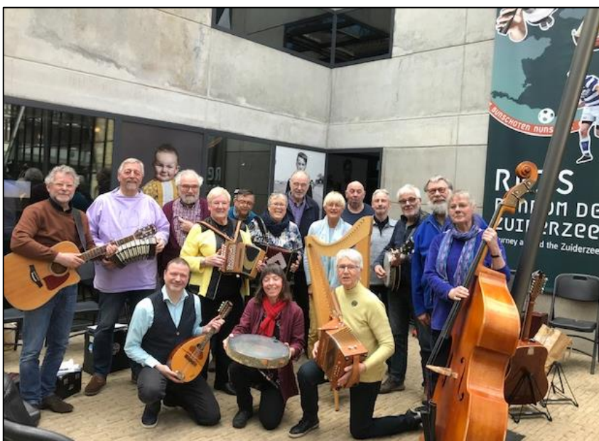
De groep in het Atrium van het Zuiderzeemuseum