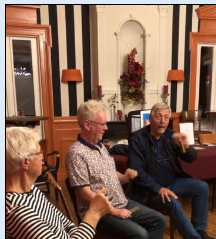
workshop HOW TO PLAY THE BONES

De kracht van een Engelse Folkclub is, dat ieders inzet/optreden, wordt gewaardeerd en gerespecteerd, ongeacht niveau!