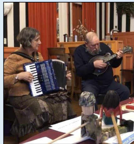
Tijdens de laatste Folkavond van 2021

De kracht van een Engelse Folkclub is, dat ieders inzet/optreden, wordt gewaardeerd en gerespecteerd, ongeacht niveau!