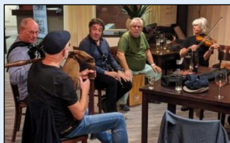
Praten over muziek en musiceren met elkander.