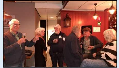
Proost op het jubileum en 'n goed weekend