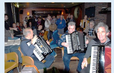
2014 – de muzikanten