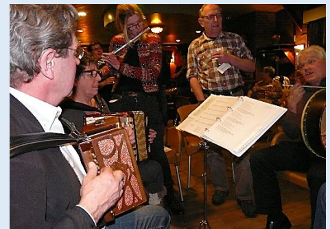
2013 – musiceren in ‘de Haven van Putten’