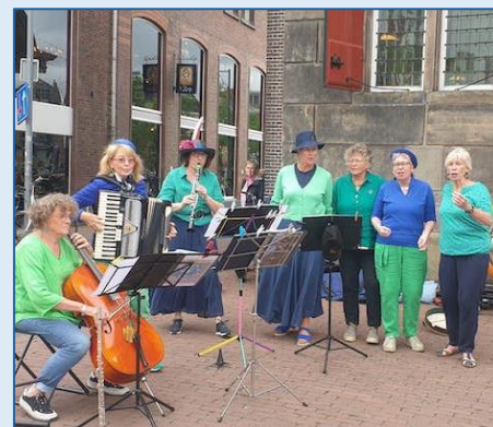
'Fieramente' – Festival Songs about Fish & Ships – Gouda - 1 juli 2023

Shanties zingen is bijgeschreven in de Inventaris Immaterieel Erfgoed Nederland